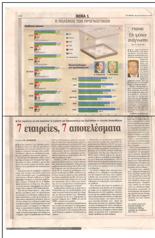
Γράφημα 6: ΒΗΜΑ (24/6/2007)

Με βάση την εμπειρία που αποκτήθηκε στις εκλογές του 2004, η εταιρεία βελτίωσε τη μεθοδολογία της, στηρίζοντας πλέον την εκτίμηση στην ανάλυση της διαχρονικής εξέλιξης της επιρροής των κομμάτων και χρησιμοποιώντας, για το σκοπό αυτό, το σύνολο των διαθέσιμων ερευνών της. Η μεθοδολογία αυτή διαφοροποίησε περαιτέρω την Public Issue από τις υπόλοιπες εταιρείες δημοσκοπήσεων, ως προς την εκτίμηση για τη διαφορά ΝΔ-ΠΑΣΟΚ, σε όλη τη διάρκεια του εκλογικού κύκλου ( γράφημα 6 ) 37 , αλλά και κατά τη διάρκεια της προεκλογικής περιόδου των εκλογών του Σεπτεμβρίου του 2007 38 , καθώς τα αποτελέσματα της πρόβλεψης οδηγούσαν στο συμπέρασμα, ότι η διαφορά μεταξύ των δύο μεγάλων κομμάτων ήταν αρκετά μεγαλύτερη από αυτή που εκτιμούσαν οι υπόλοιπες εταιρείες.