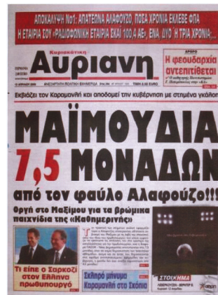
Γράφημα 4: ΑΥΡΙΑΝΗ (12/4/2009)

Παρά την εξαιρετικά επιτυχή πρόβλεψη του εκλογικού αποτελέσματος, στις εκλογές της 16 ης Σεπτεμβρίου του 2007 (βλέπε και παρακάτω), οι επικρίσεις κατά της εταιρείας δεν τερματίστηκαν. Τον Απρίλιο του 2009 , δηλαδή μόλις 1½ χρόνο μετά, εκδηλώθηκε νέα επίθεση, όταν η Public Issue εκτίμησε για πρώτη φορά -πέντε (5) μήνες πριν από την εκλογική συντριβή της ΝΔ- τη διαφορά μεταξύ ΠΑΣΟΚ και ΝΔ σε 7,5% , υπέρ του ΠΑΣΟΚ 12 . Η εκτίμηση αυτή, που –σημειωτέον– δημοσιεύθηκε στην ΚΑΘΗΜΕΡΙΝΗ 13 , αν και κατέγραψε εξαιρετικά έγκαιρα, όπως αποδείχθηκε τελικά, την συντελεσθείσα μεταστροφή του εκλογικού σώματος υπέρ του ΠΑΣΟΚ, προκάλεσε θύελλα αντιδράσεων. Χαρακτηριστικότερο όλων των (έντυπων) επιθέσεων είναι το πρωτοσέλιδο της